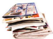
Dagblöð og tímarit

Mikilvægt að leggja saman pappakassa til að minnka rúmmál.