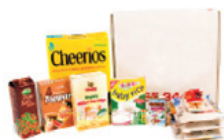
Sléttur pappi / fernur

Mikilvægt að samþjappa í stærri ílát til þess að hindra fok við losun.