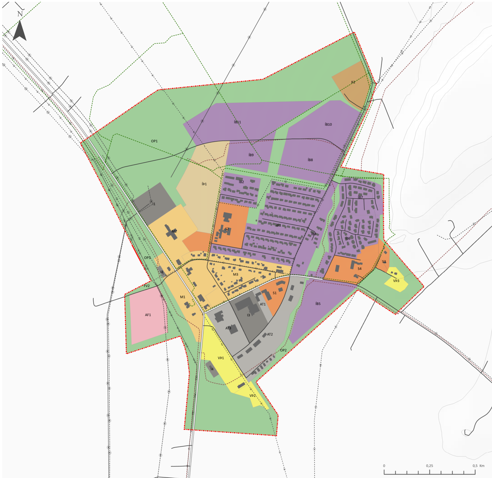
Þéttbýlisuppráttur Hvolsvöllur 1:10.000