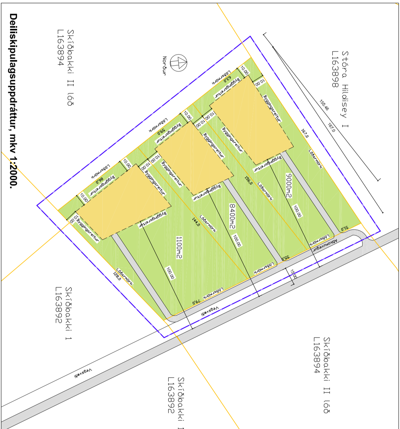
Deiliskipulagsuppráttur, mkv 1:2000.