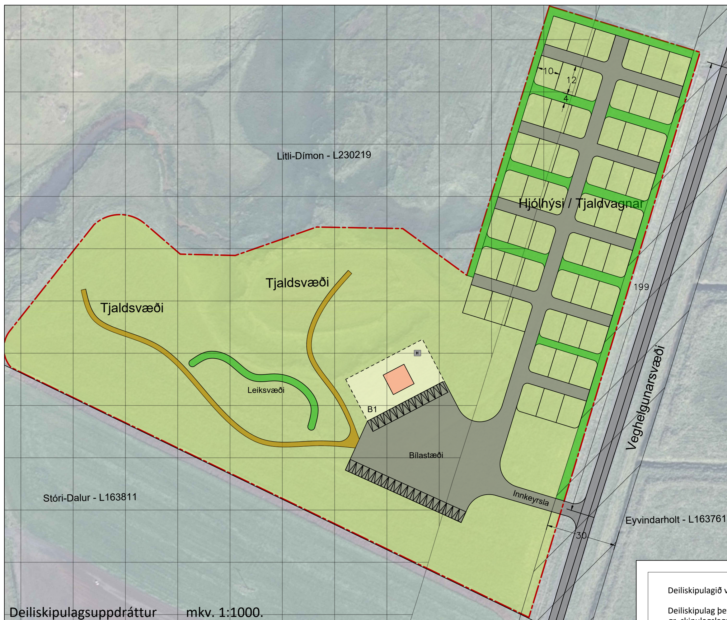
Deiliskipulagsuppráttur mkv. 1:1000.

Aðkoma að lóðinni er frá Þórsmerkurvegi nr. 249 sem er skilgreindur tengivegur á vegaskrá Vegagerðarinnar. Gert er ráð fyrir nýjum afleggjara inn á svæðið sem er í um 200 metra fjarlægð frá afleggjara Merkurvegar nr. 248. Staðsetning og fjöldi bílastæða er sýnt til skýringa, nákvæm staðsetning, fjöldi og útfærsla bílastæða er leyst með ítarlegri hætti á afstöðumynd aðaluppráttar fyrir þjónustuhús. Gert er ráð fyrir um 30-40 bílastæðum á svæðinu. Gert er ráð fyrir því að bílastæði verði þjappaður malarpúði. Helgunarsvæði vega er skilgreint 15 metra frá miðlinu Þórsmerkurvegar.