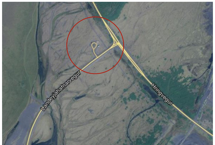
Mynd 1. Skipulagssvæðið.

Skipulagssvæðið tekur til um 1,6 ha spildu í landi Brúna 1. Svæðið er er við tengingu af Suðurlandsvegi til Landeyjarhafnar, skammt vestan Markafljóts. Svæðið liggur meðfram Landeyjarhafnarvegi, upphaflega í landi Brúna (L163751) og er á lóðinni Brúnum – vegur (L218558). Svæðið er uppgræddir melar en er mikið raskað, bæði vegna flóða áður en Suðurlandsvegur og varnagarðar voru byggðir og einnig í tengslum við vegagerð þar sem nýr vegur var lagður til Landeyjarhafnar.