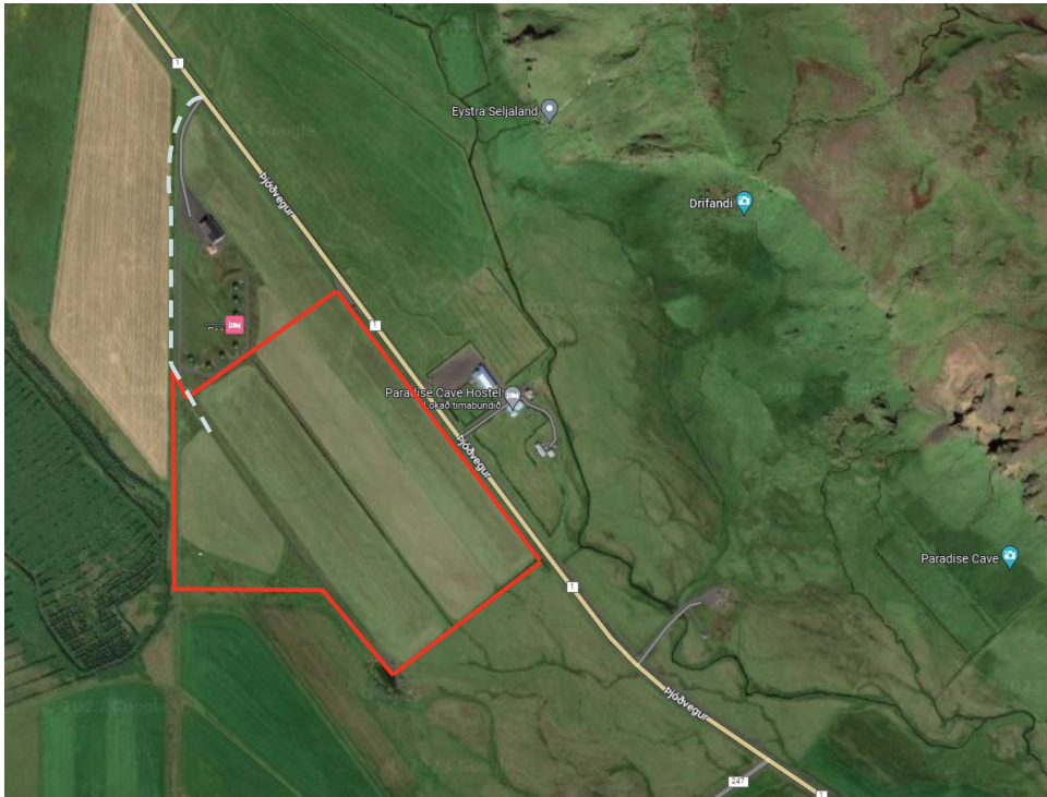
MYND 1. Skipulagssvæðið er merkt með rauðu og aðkoma er brotalína.