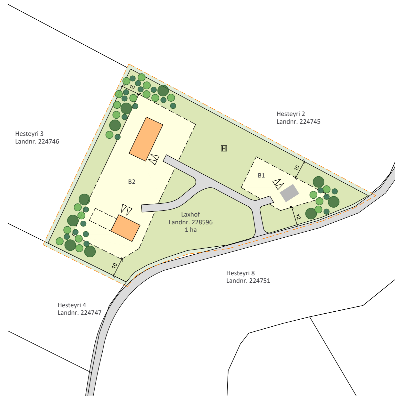
BREYTTUR DEILISKIPULAGSUPPDRÁTTUR Í MKV. 1:1000

B1 - innan byggingarreits er fyrir 50 m 2 gestahús.