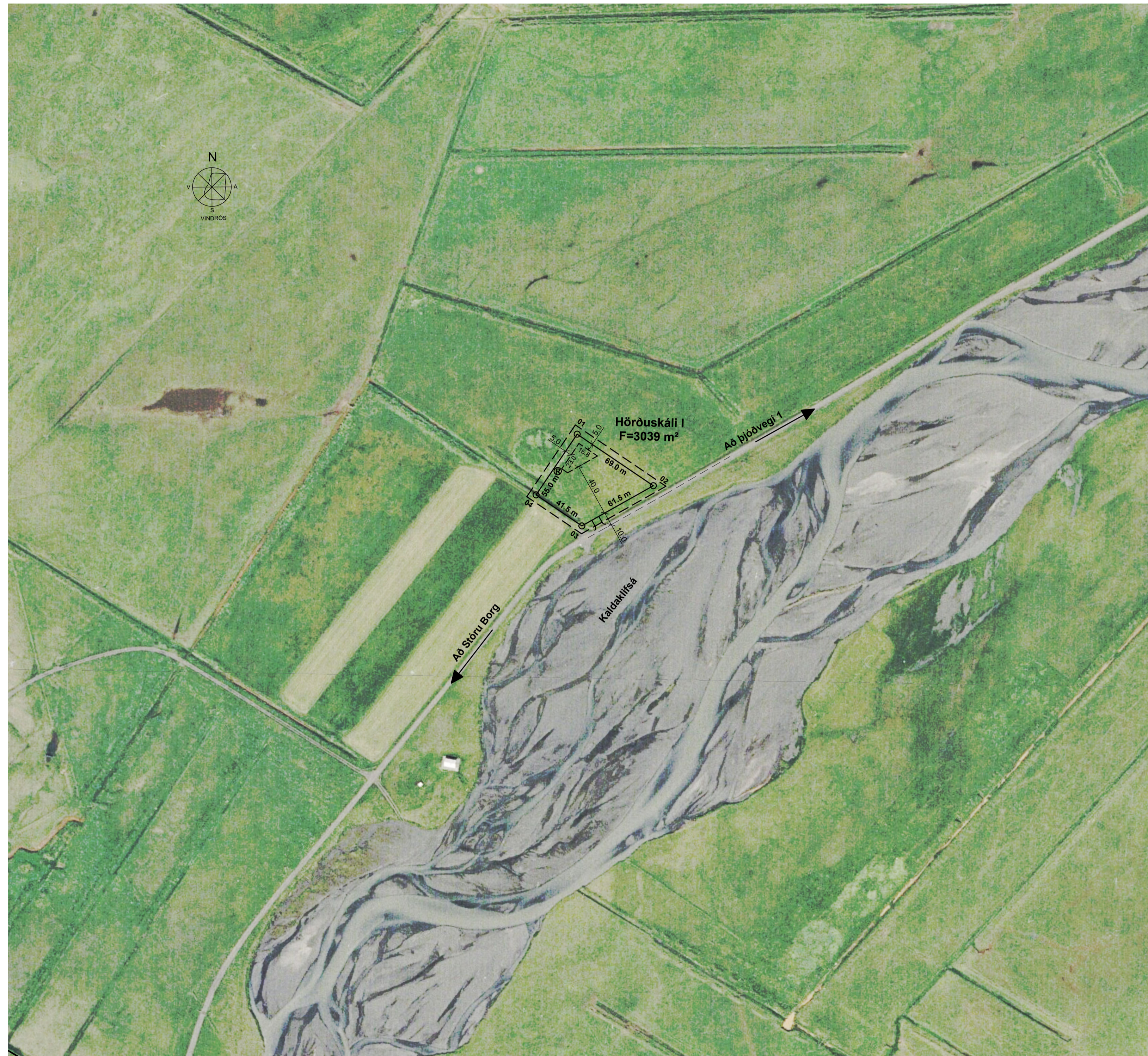
Deiliskipulag, mkv. 1:2000

Stærð á húsum skal vera innan við 100 m 2 og á einni hæð. Hæð á mæni frá gólfkóta skal vera innan við 4.2 m. Mænisstefna skal vera í austur-vestur. Ásýnd og litir bygginga skulu falla vel að nánast umhverfi.