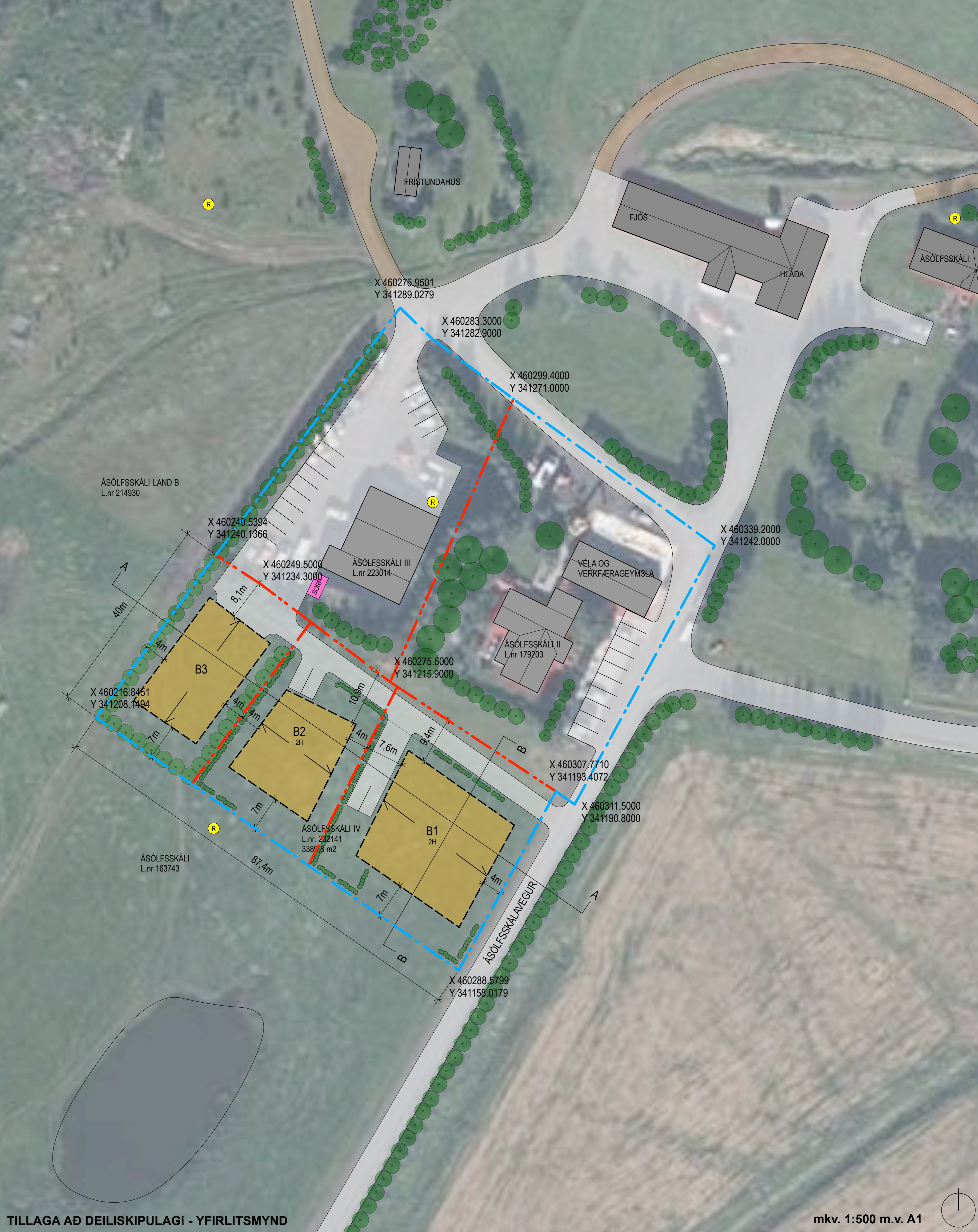
TILLAGA AÐ DEILISKIPULAGI - YFIRLITSMYND