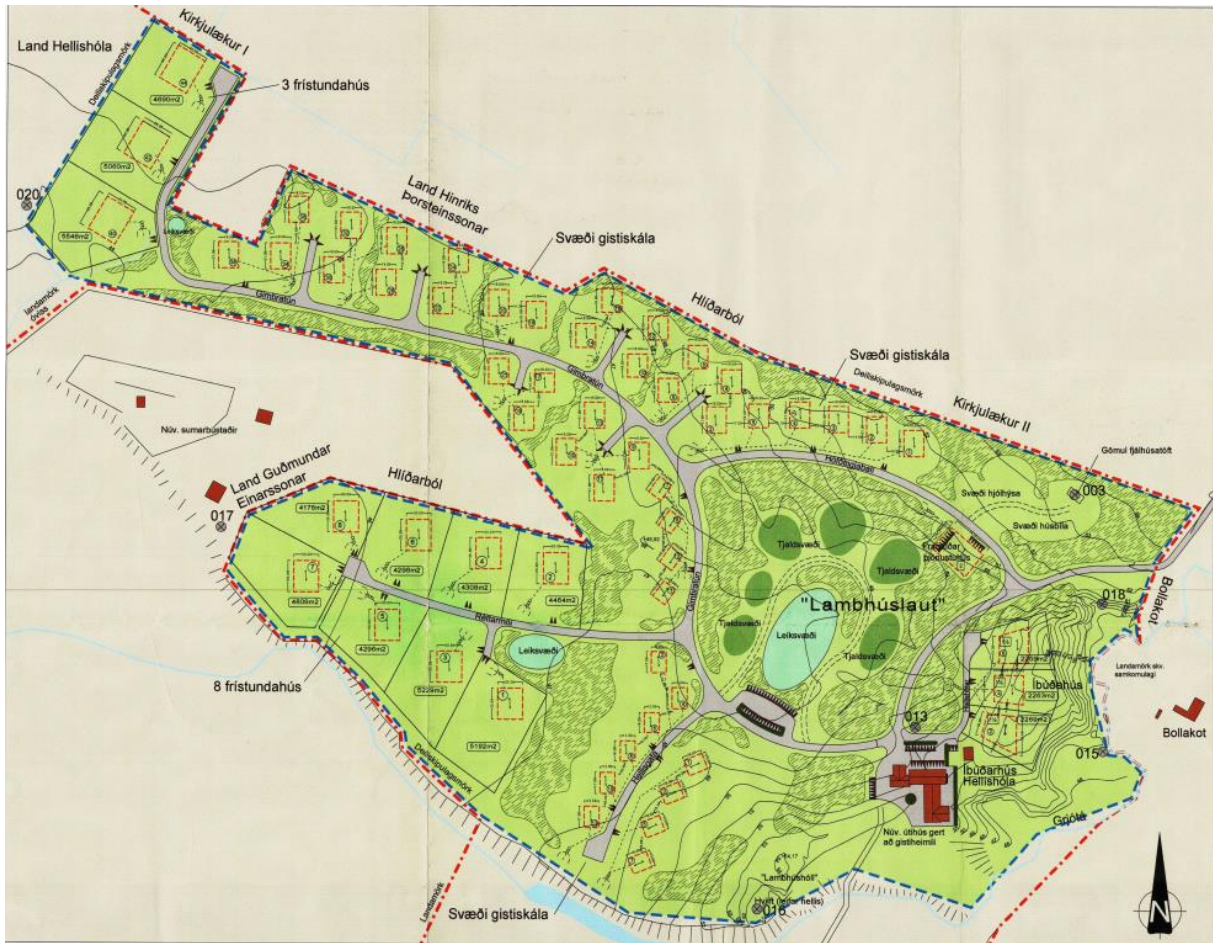
MYND 4. Gildandi deiliskipulag fyrir svæðið.

Í gildi er deiliskipulag frístundahúsa- og ferðapjónustusvæðis á Hellishólum í Fljótshlíð frá árinu 2001. Stærri frístundabyggðin verður skilgreind í Lambhúsalaus en hitt, minna, svæðið er ekki innan deiliskipulags, en verður það staðsett beint suður af íbúðarhúsinu.