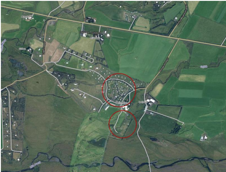
MYND 2. Svæðið sem breytingum tekur er innan rauðu hringanna 2 .