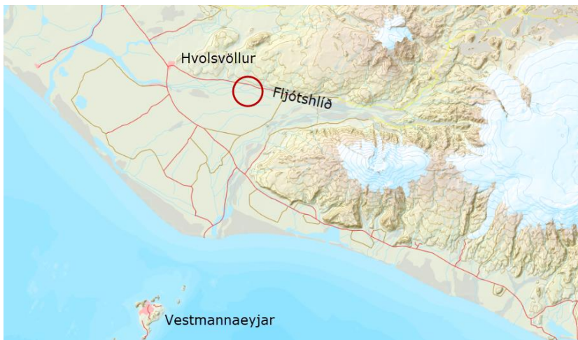
MYND 1. Yfirlistmynd yfir suðurland. Svæðið er afmarkað með rauðum hring 1 .

Svæðið sem breytingum tekur nær til Hellishóla. Aðkoma að svæðinu er frá Fljótshlíðarvegi nr. 261 um Bollakotsveg austan frá en aðkomuvegi meðfram Kvoslækjará vestan frá.